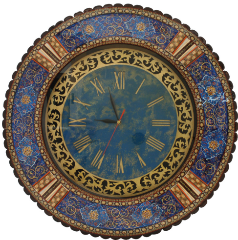
S27: ساعت خاتم معرق چوب / سایز: ۳۰-۴۰-۴۵-۵۵ cm