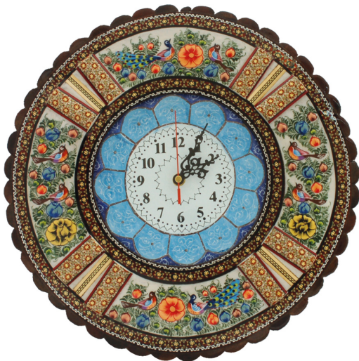
ساعت خاتم با مینا/سایز: ۳۰-۴۰-۴۵-۵۵ cm: S14