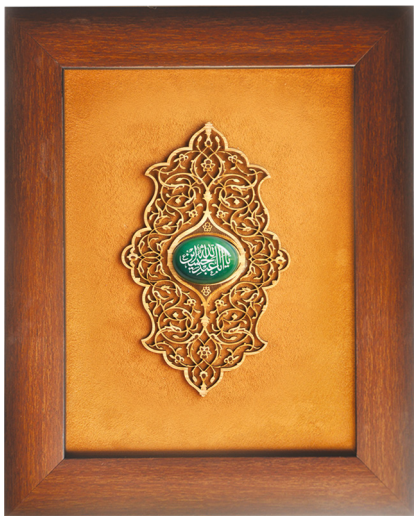
کتبیہ و عقیق یا ابا عبد اللہ ﷺ / ابعاد: ۳۰*۴۰ : H31