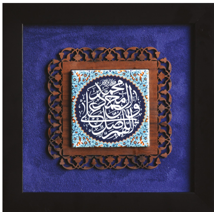
H11: قاب کاشی صلوات (سایز کاشی ۱۰*۱۰): ابعاد: ۳۰*۳۰