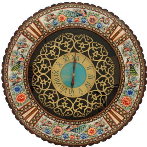
S30: ساعت خاتم معرق چوب / سایز: ۳۰-۴۰-۴۵-۵۵ cm