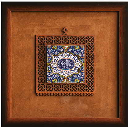
قاب کاشی یا علی بن موسی الرضا علیه السلام (سایز کاشی: ۱۰*۱۰) / ابعاد ۳۰*۳۰: H20