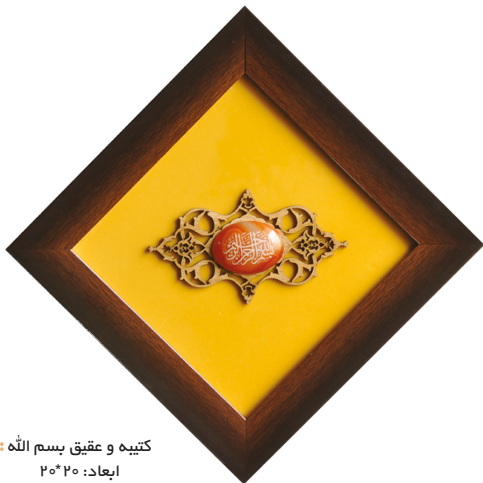
H32: کتیه و عقیق بسم الله ابعاد: ۲۰*۲۰