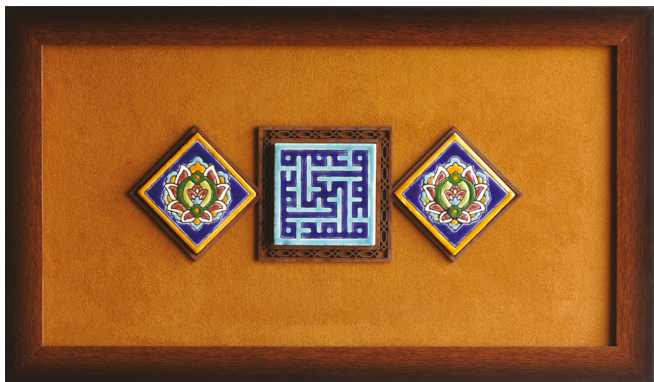
H23: قاب کاشی هفت رنگ با اسم حضرت محمد ﷺ و حضرت علی علیه السلام (سایز کاشی: ۱۰*۱۰) / ابعاد ۴۵*۲۵