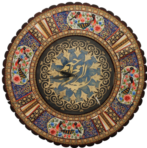
S29: ساعت خاتم معرق چوب / سایز: ۳۰-۴۰-۴۵-۵۵ cm