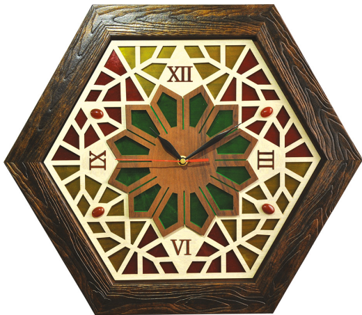
ساعت معرق نگین دار/ابعاد: ۴۵*۴۵: S28