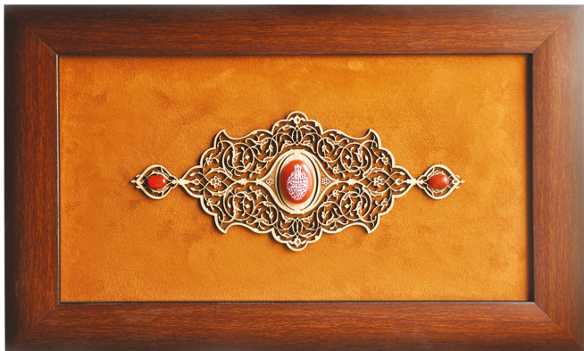
کتبیہ و عقیق بسم اللہ / ابعاد: ۳۰*۵۰: H27