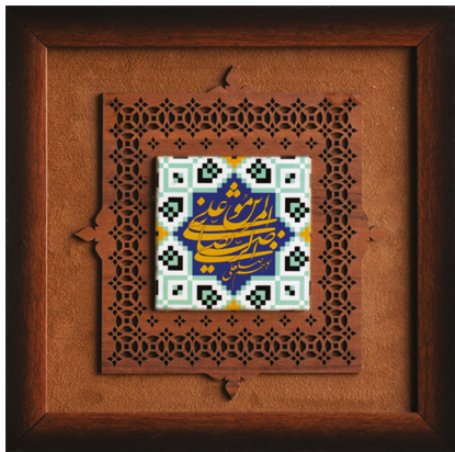
قاب کاشی (سایز کاشی: ۱۰*۱۰) ابعاد: ۳۰*۳۰ H12: