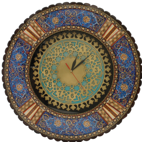
S26: ساعت خاتم معرق چوب / سایز: ۳۰-۴۰-۴۵-۵۵ cm