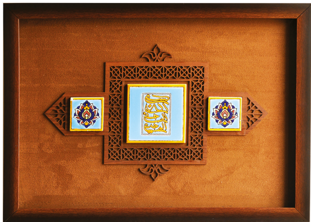
H21: قاب کاشی هفت رنگ بسم الله / ابعاد ۴۰*۵۰