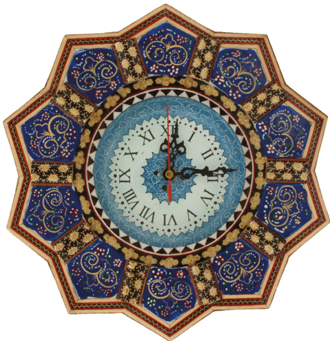
S15: ساعت خاتم با مینا/سایز: ۳۰-۴۰-۴۵-۵۵ cm