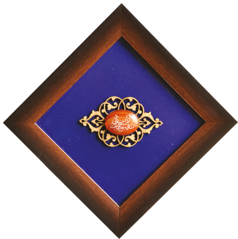
كتيبه و عقيق يا صاحب الزمان / ابعاد: ٢٠*٢٠ H34: عذرة الشرف