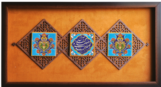
H19: قاب کاشی هفت رنگ صلوات/ابعاد ۴۰*۷۰