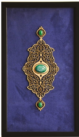
كتيبه و عقيق يا حجة الله / ابعاد: ٣٠*٥٠ H30: