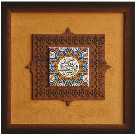
H10: قاب کاشی ملوات (سایز کاشی: ۱۰*۱۰) / ابعاد ۳۵*۳۵