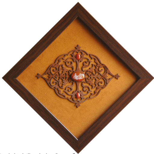
H29: ٣٠*٣٠ ابعاد: ٣٠*٣٠ كتيبه و عقيق يا صاحب الزمان / ابعاد: ٣٠*٣٠