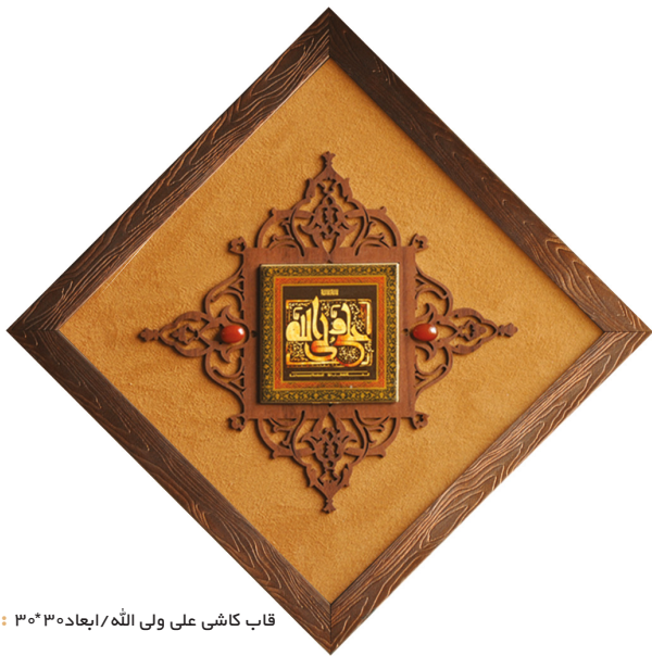
H24: قاب کاشی علی ولی اللہ / ابعادہ ۳۰*۳۰