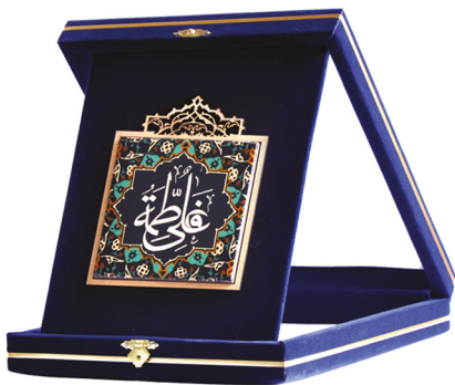
لوحة كاشي علي و فاطمه عليهما السلام / ابعاد: ٢١*٢٦: H27