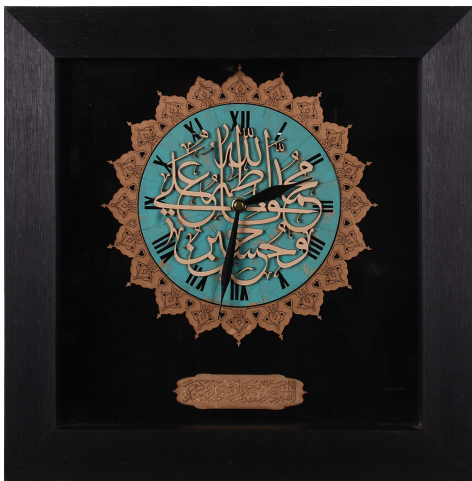
ساعت معرق طرح ۵ تن / ابعاد ۳۵*۳۵: S25