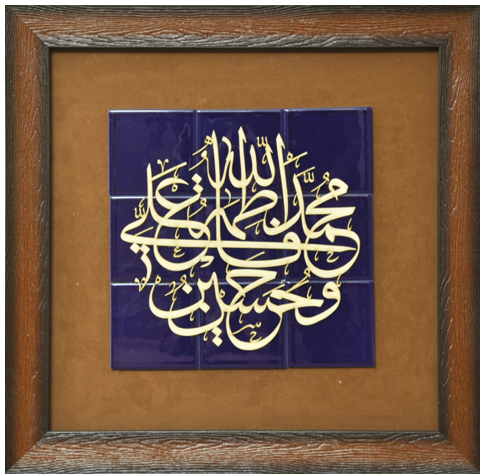
H17: قاب کاشی پنج تن برجسته / ابعاد ۴۵*۴۵