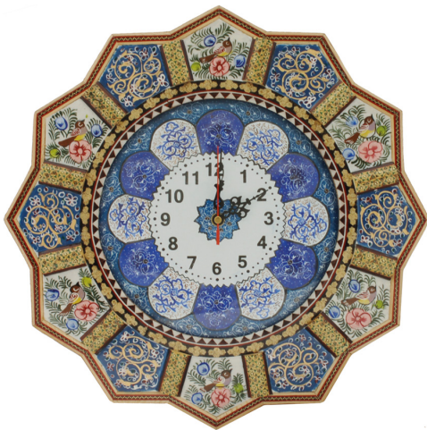
S16: ساعت خاتم با مینا/سایز: ۳۰-۴۰-۴۵-۵۵ cm