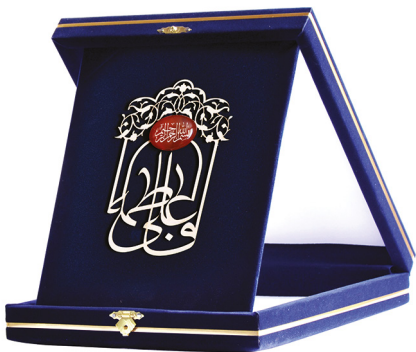
لوح علی و فاطمه عليهما السلام همراه با عقیق بسم الله / ابعاد: ۲۱*۲۶: H26