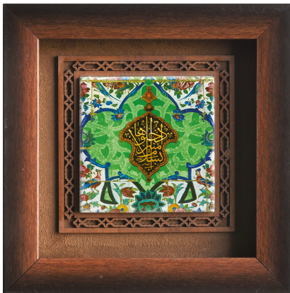
H22: قاب کاشی ادخلوها بسلام آمینین / ابعاد ۲۰*۲۰