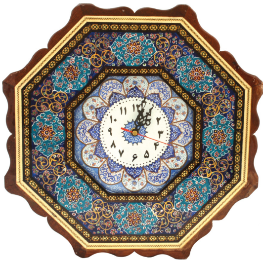
S17: ساعت خاتم با مینا/سایز: ۳۰-۴۰-۴۵-۵۵ cm