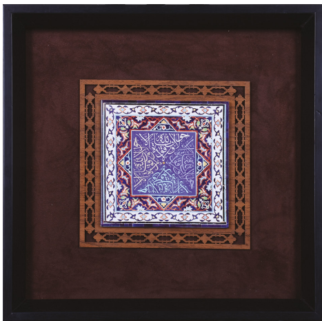
H16: قاب کاشی لا حول و لا قوة (سایز کاشی ۱۵*۱۵) ابعاد: ۳۵*۳۵