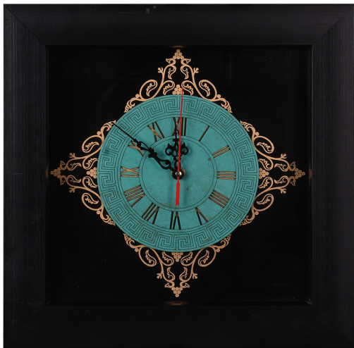
ساعت معرق طرح یونانی / ابعاد ۳۵*۳۵: S24