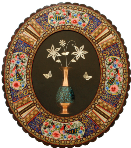
S12: قاب خاتم و گلدان فیروزه کوبی (سایز ۲۰ و ۱۶ cm) و گل نقره / ابعاد: ۴۰*۵۰