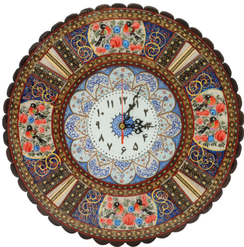
ساعت خاتم با مینا/سایز: ۳۰-۴۰-۴۵-۵۵ cm: S10