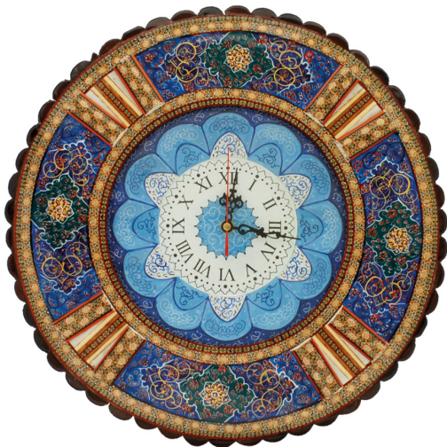
S13: ساعت خاتم با مینا/سایز: ۳۰-۴۰-۴۵-۵۵ cm