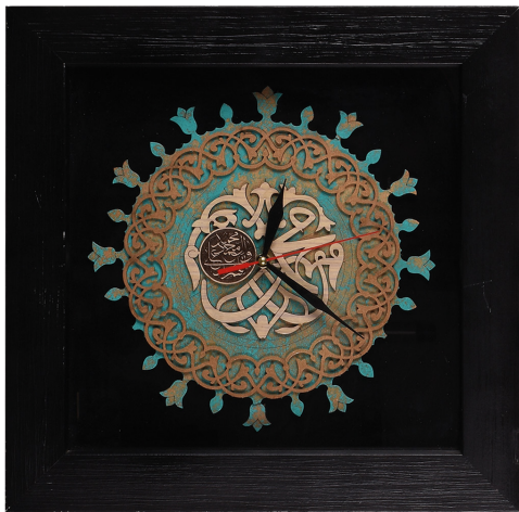
S22: ساعت معرق ملوات / ابعاد ۳۵*۳۵