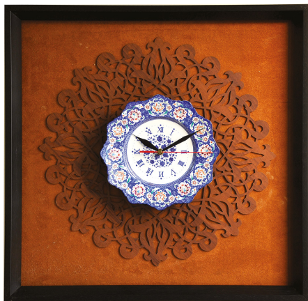
ساعت مینا معرق / ابعاد ۵۰*۵۰: S20