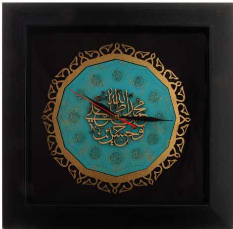
S19: ساعت معرق ۱۲ امام / ابعاد ۳۵*۳۵