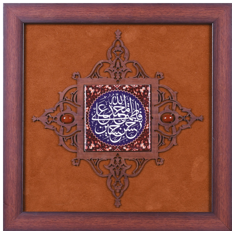
قالب کاشی پنج تن با نگین (سایز کاشی: ۱۰*۱۰) / ابعاد: ۳۰*۳۰ H18: