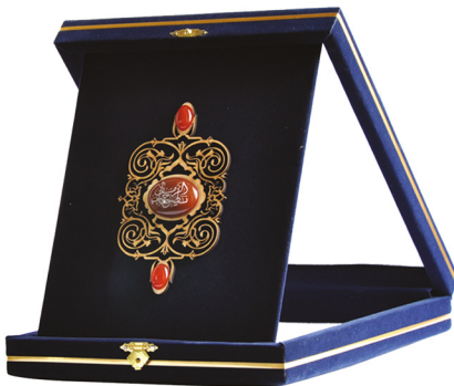
لوحة همراه با عقیق یا صاحب الزمان عَلَيْهِ السَّلَام / ابعاد: ۲۱*۲۶: H25