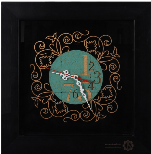
ساعت معرق طرح اعداد/ابعاد ۳۵*۳۵: S23