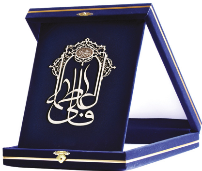
لوحة علي و فاطمة عليهما السلام همراه با پلاک بسم الله / ابعاد: ۲۱*۲۶ H27: