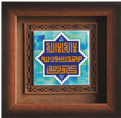
قاب کاشی (سایز کاشی: ۱۰*۱۰) ابعاد: ۲۰*۲۰ H13: