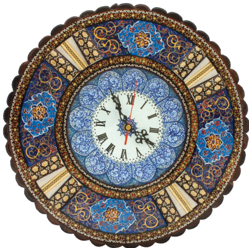
S11: ساعت خاتم با مینا/سایز: ۳۰-۴۰-۴۵-۵۵ cm