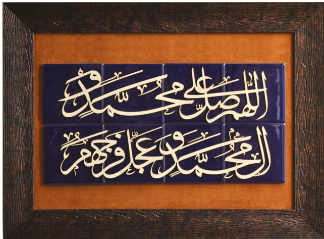
H15: قاب کاشی صلوات برجسته / ابعاد ۵۰×۳۰